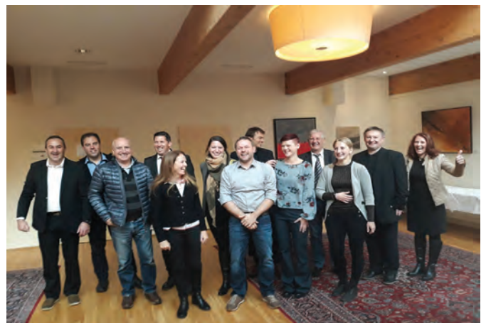
Veliko veselje delegacij iz doline Gschnitztal in občine Luče po potrditvi kandidature v Salzburgu

Naslednji korak je bila predstavitev občine pred mednarodnim upravnim odborom projekta Gorniške vasi, ki odloča o sprejemu novih kandidatov. Zasedanje odbora je potekalo 19. novembra 2018 v Salzburgu. Občina Luče je predstavitev uspešno opravila in bila kot druga destinacija v Sloveniji sprejeta v družino Gorniških vasi.