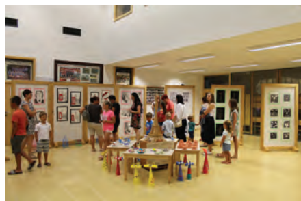
Otvoritev razstave likovnih izdelkov v Osnovni šoli Blaža Arniča Luče