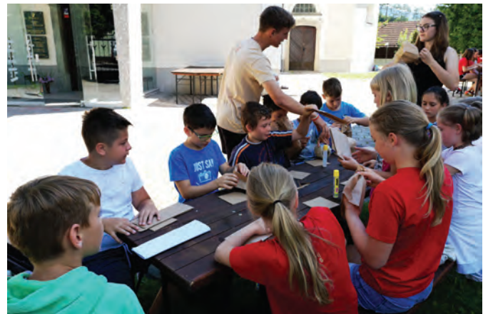
Tudi ustvarjalne delavnice so del oratorija