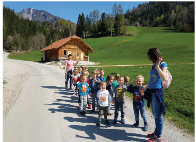
Vsakodnevni sprehod po bližnji okolici

Polžki so pripravili žajbljev in lovorjev sirup, pekli so medenjake, poskušali med, propolis, različno sadje in spoznavali so, kaj je dobro za njihovo zdravje (higiena, gibanje ...). Ježki so v okviru projekta izvajali dejavnosti na temo Buča