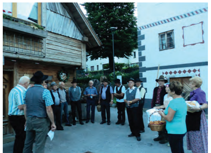
Prireditev Petje po vasi je požela navdušen odziv številnih gostov in domačinov ter lepo popestrila dogajanje v kraju