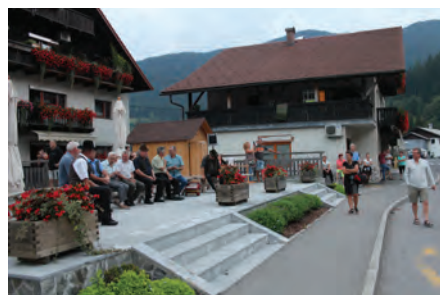
Obujanje tradicije petja "po vrhek" z ljudskimi pevci na kmečki tržnici v organizaciji KUD Tone Mlačnik