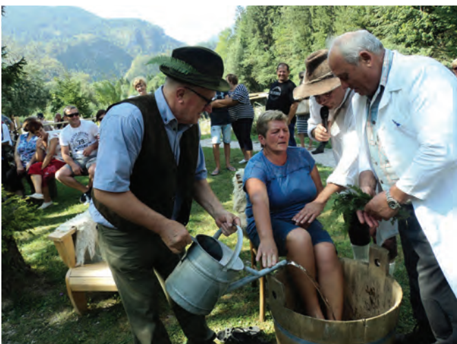
Gozdni zdravnik je izvajal posebne metode zdravljenja