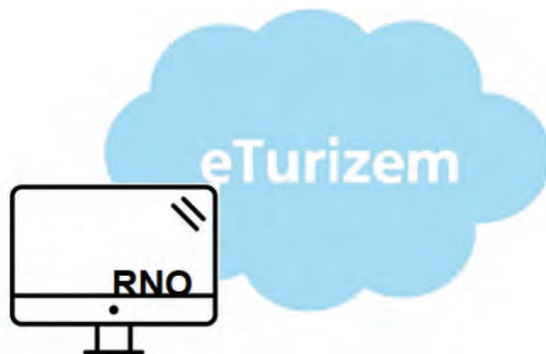
Aplikacija eTurizem je nov sistem sporočanja podatkov o prihodih in prenočitvah turistov

Besedilo Odloka o turistični in promocijski taksi v Občini Luče je dostopno tudi na spletni strani Občine Luče www.luce.si . Za več informacij se lahko obrnete na Turistično-informacijski center Luče, 03/839 35 55, tic@luce.si .