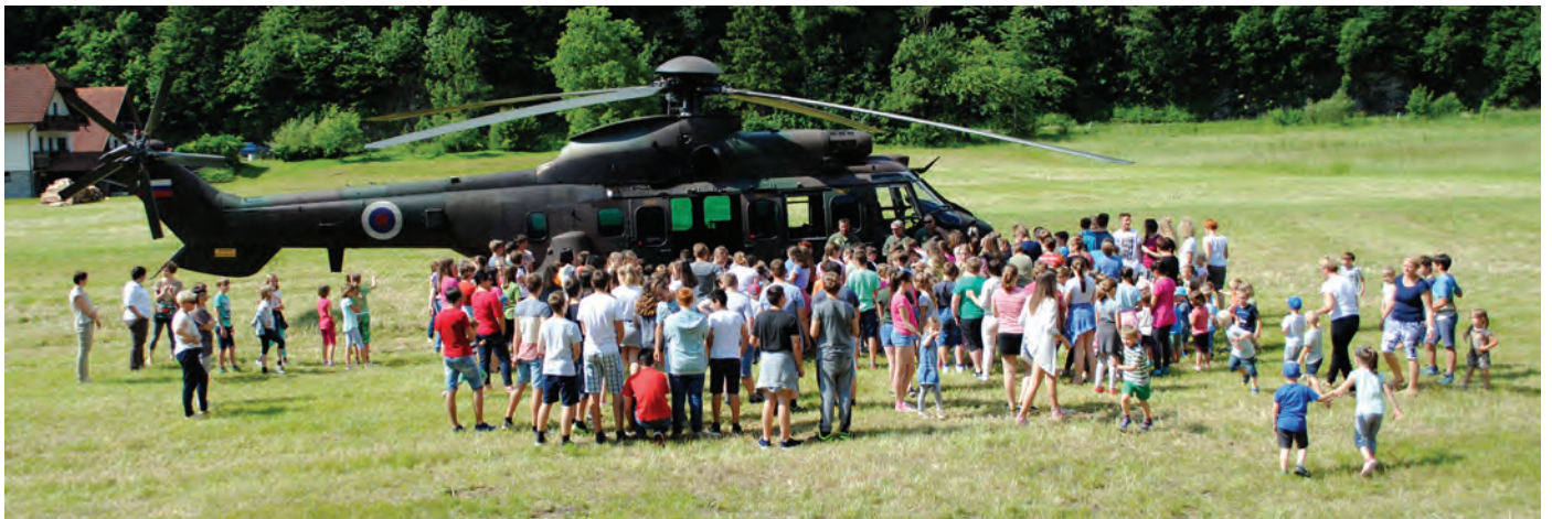
Med vojaško vajo, ki je potekala na območju Luč, so si učenci z zanimanjem ogledali vojaški helikopter

tudi v projektu Naravni parki Slovenije. Smo tudi ekologi in skozi celo šolsko leto smo zbirali star papir ter plastične zamaške, sodelovali smo na Kvizu o lesarstvu in gozdarstvu.