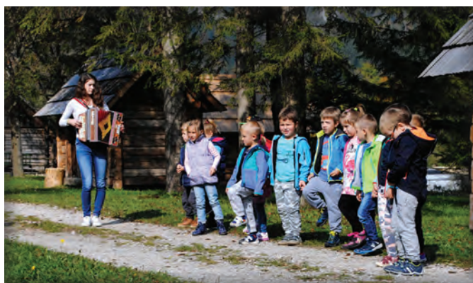
V okviru projekta Dediščina gre v šole so otroci raziskovali pomen vode nekoč in danes

V šolskem letu 2017/18 je osnovno šolo obiskovalo 180 otrok, od tega jih je bilo 25 na podružnici v Solčavi. Vsirazredisobilienooddelčni, v Solčavi pa so učenci obiskovali pouk v dveh kombiniranih oddelkih. Od 1. septembra 2017 pa do 22. junija 2018, ko so učenci odšli na poletne počitnice, smo sledili ciljem Letnega delovnega načrta. Večina zastavljenih ciljev je realiziranih, tako otroci kot zaposleni pa smo pridobili nova znanja, za uspešno opravljeno delo pa tudi veliko priznanj.