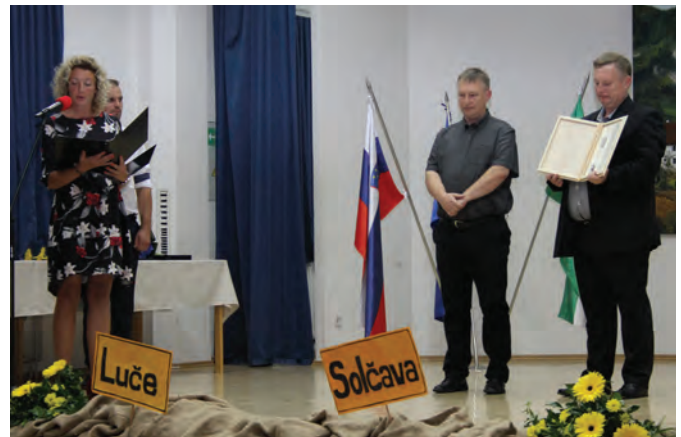
Metod je do sedaj izdelal preko dvesto rodovnikov, ki so romali na štiri svetovne kontinente

Ker se rodoslovje v zadnjem času zelo prepleta tudi z genetiko, je bil glavni pobudnik, da kljub geografski oddaljenosti poskušamo v Lučah iti v korak s sodobnimi trendi tudi na področju