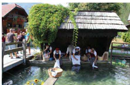
Na perišču so kot nekoč prale in prepevale lučke perice