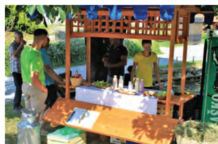
V okviru prireditve Od štanta do štanta so se predstavili domači ponudniki, rokodelci in ustvarjalci