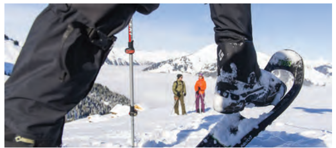
Zimske pohodniške ture v dolini Walsertal

Da bi projekt v praksi uspešno zaživel, mora uživati podporo tako pri lokalni oblasti kot pri domačem prebivalstvu. Pred nadaljevanjem pridružitvenega postopka je bil projekt zato podrobneje predstavljen tudi občanom, ki so informacijo pozitivno sprejeli in vključitev tudi soglasno podprli.