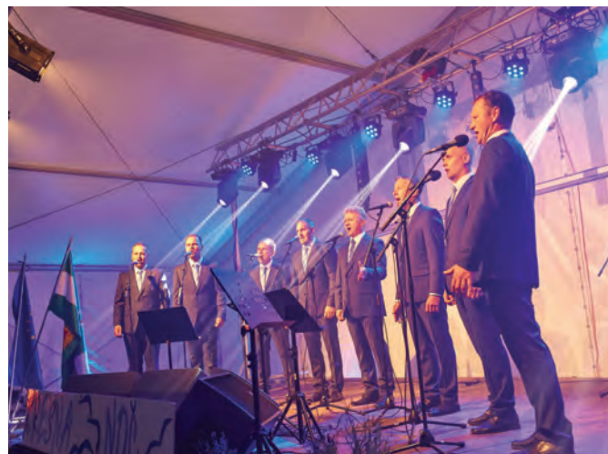
Člani Okteta Žetev vsako leto poskrbijo za pravi spektakel

Seveda pa so prijeten večer popestrili tudi člani Okteta Žetev, ki so se s pesmijo Samo milijon poklonili Sloveniji ob njenem prazniku, vmes pa je zazvenel še Ribnčan Urban ter številne druge ubrane pesmi. Da glasba ne pozna meja, je prav gotovo pokazala tudi dalmatinska pesem v izvedbi Okteta Žetev in »naš« Dan ljubezni v izvedbi klope Cambi.