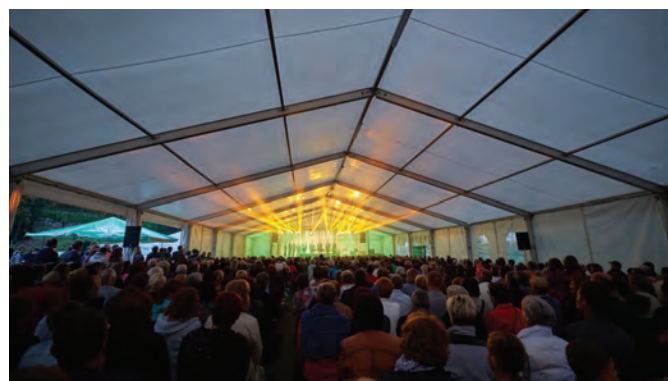
Obiskovalci so napolnili prireditveni šotor do zadnjega kotička

Seveda pa so prijeten večer popestrili tudi člani Okteta Žetev, ki so se s pesmijo Samo milijon poklonili Sloveniji ob njenem prazniku, vmes pa je zazvenel še Ribnčan Urban ter številne druge ubrane pesmi. Da glasba ne pozna meja, je prav gotovo pokazala tudi dalmatinska pesem v izvedbi Okteta Žetev in »naš« Dan ljubezni v izvedbi klope Cambi.