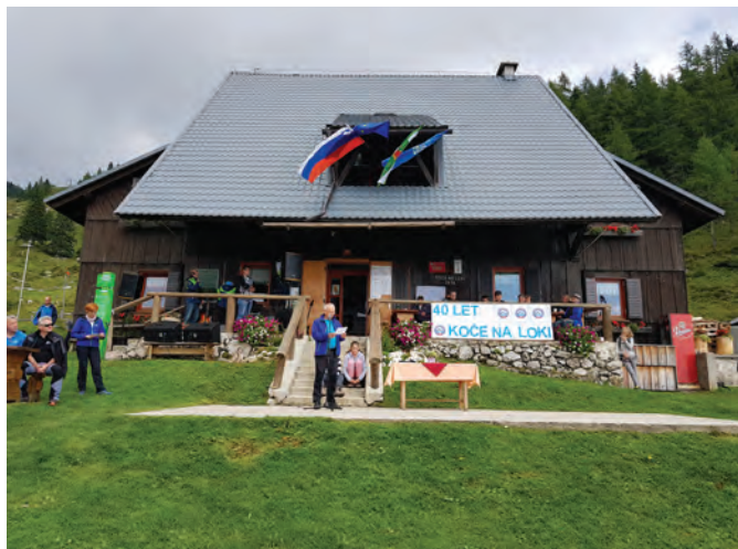
Planinsko društvo Luče vsa leta zgleđno skrbi za kočo

Ob vznožju Raduhe, na lokaciji današnje, je bila prvič koča postavljena že leta 1903, a je bila med I. svetovno vojno požgana. Po vojni so zgradili novo, lovsko kočo, a je tudi to kočo med II. svetovno vojno doletela enaka usoda. Po vojni je novo kočo zgradilo GG Nazarje in leta 1955 jo je v upravljanje prevzelo Planinsko društvo Luče.