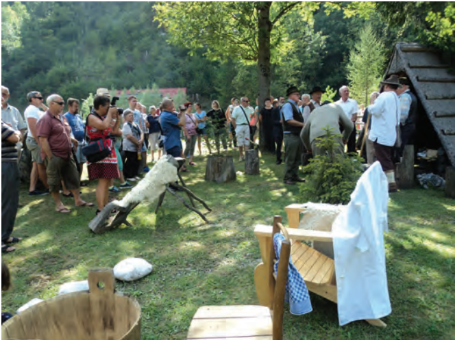
Prizorišče vedrega dogajanja pred skorjevko