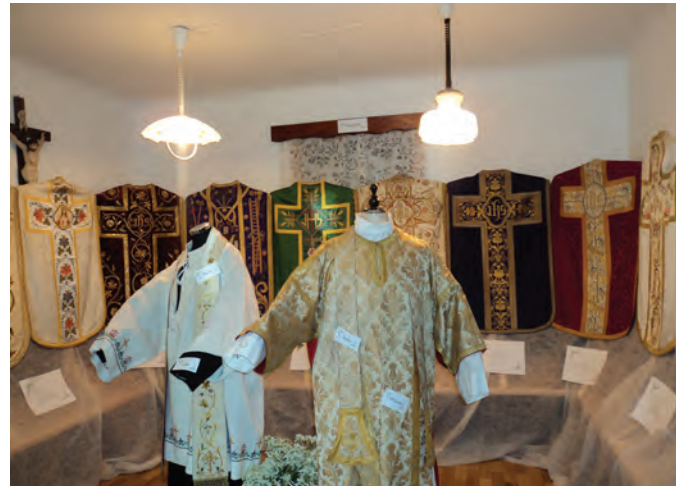
Razstava mašnih plaščev in zapisov iz župnijske kronike v Hiški dobrodelnosti