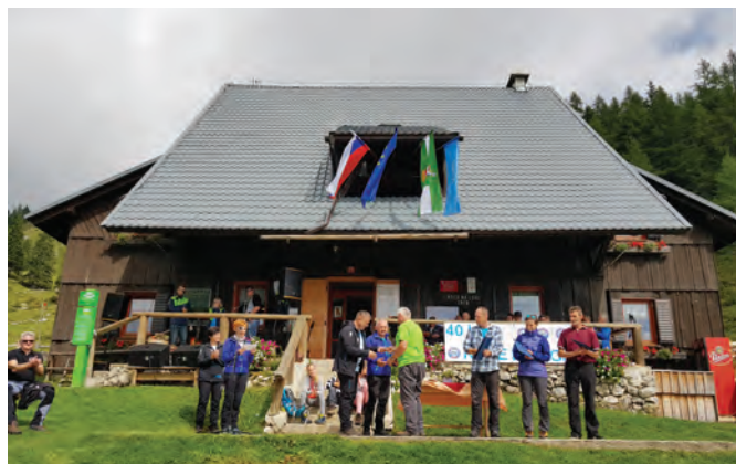
Zaslužne člane društva so nagradili

Zaradi te pridobitve ter okroglega jubileja so planinci 8. septembra 2018 na Loki pripravili slovesno prireditvev. Ob srečanju lučkih planincev in njihovih prijateljev so pripravili kulturni program, zaslužne planince pa so tudi nagradili. Tako so štiri mentorice mladih planincev prejele pohvale Planinske zveze Slovenije, podelili pa so tudi tri bronaste ter pet častnih znakov Planinske zveze Slovenije.