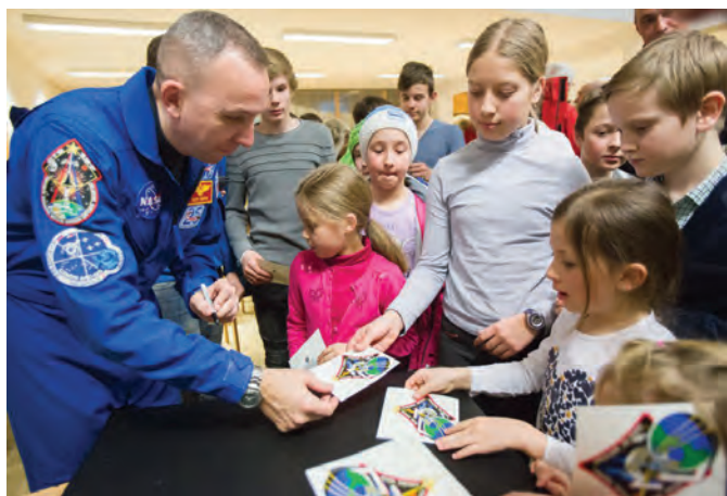
Za Randyjev avtogram je bilo precej zanimanja

Po kar nekaj neodvisnih študijah smo na področju turizma v zadnjih letih ena od slovenskih občin v največjem vzponu. Upajmo, da bomo ta trend znali obdržati in ga v prihodnje tudi pravilno usmerjati.