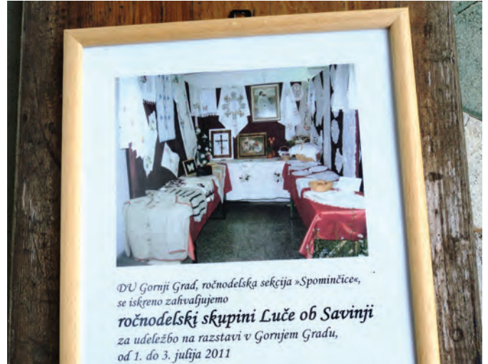
Zahvala ročnodelski skupini za sodelovanje na razstavi v Gornjem Gradu

začetnicam s svojim znanjem in izkušnjami, vmes popijejo kavico, malo klepetajo (ko ni potrebno šteti zank) ... in ustvarjajo vsaka svoje čudovite izdelke. Za to leto je padla pobuda, da bi se bolj posvetili učenju kvačkanja (morda zato, ker so prebrale v stari pratiki Turistične zveze, da so bile Luče včasih zelo znane po kvačkanju), sicer se pa zelo svobodno odločajo, kaj bo katera delala. Tisti dve uri srečanja in skupnega dela jim res veliko pomeni in hitro mine.