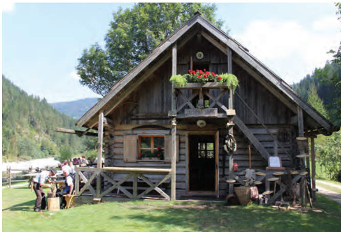
Vlcerska bajta postaja prijetno družabno središče

Želimosi, da bi prireditve postala tradicionalna. Upoštevali smo priporočilo, da smo jo uvrstili datumsko bliže osrednji občinski prireditvi Lučki dan, ko je pri nas že več gostov in veseli smo bili pozitivnih sporočil, da je prireditve lepo popestrila dogajanje v kraju.