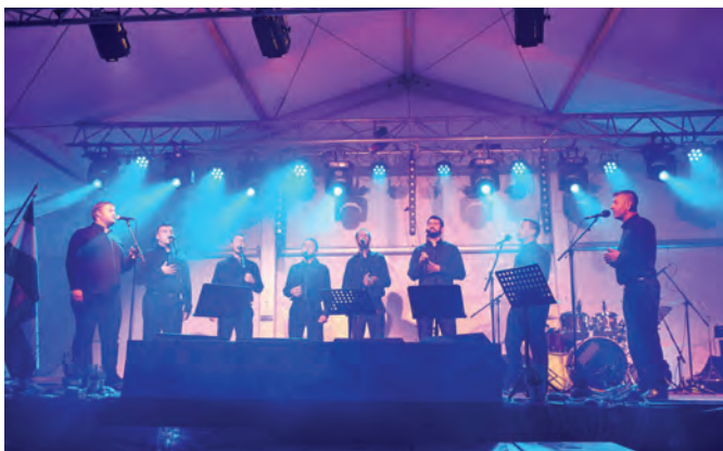
Klapa Cambi nastopa že od leta 1986

Kot gostje pa so nastopili tudi člani moške klope Cambi iz Kaštel Kambelovca, ki nastopa že od leta 1986 in je prav tako zelo znana daleč naokoli. Leta 2013 so imeli celo severnoameriško turnejo in so tudi onkraj oceana promovirali dalmatinsko klapsko pesem.