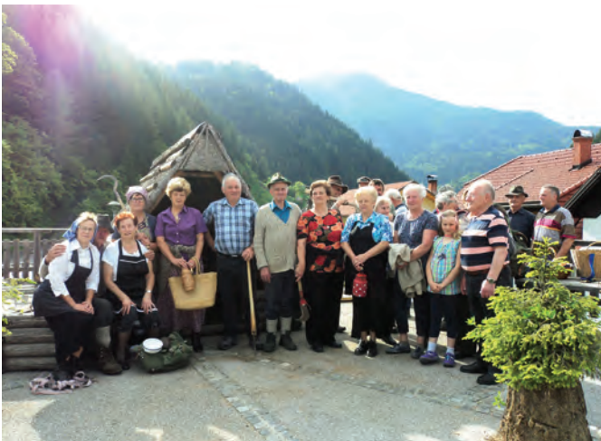
Ohranjanje dediščine prednikov je ena od pomembnih nalog društva upokojencev