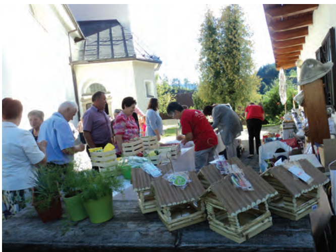
Zbrana sredstva na dobrodelnem srečelovu pomagajo pri uresničevanju programa pomoči

Na kakšen način? Tako da pomagajo pri različnih projektih in konkretnem reševanju stisk bližnjih, pri organiziranju različnih pomoči za posameznike, družine, bolnike, osamljene, stare ljudi ... Tako da uresničujejo zastavljen program in z malimi koraki dobrodelnosti, s sočutnim odnosom in delovanjem med ljudmi spreminjajo položaj, stiske in preizkušnje na bolje. Prostovoljno delo in bližina do tistih, ki se znajdejo v stiski, obogati oboje.