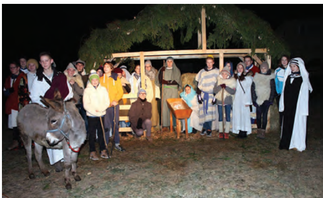
Božična zgodba na Hočevarjevi njivi

Mladinska skupina, ki pripravlja oratorije, šteje vsako leto okoli 30 članov. Najmlajše animatorje od leta 2015 dalje povabimo k sodelovanju že ob koncu osnovne šole, njihovo sodelovanje pa traja največkrat do konca srednje šole in le izjemoma ostanejo animatorji še dlje. Od leta 2010 vsako leto za animatorje v septembru organiziramo duhovne vaje v Sončni hiši Slovenske Karitas v Portorožu.