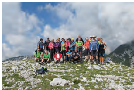
Planinski pohod na Dleskovec v organizaciji Planinskega društva Luče