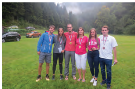
Športno rekreativno društvo Log je izvedlo vrsto športnih turnirjev