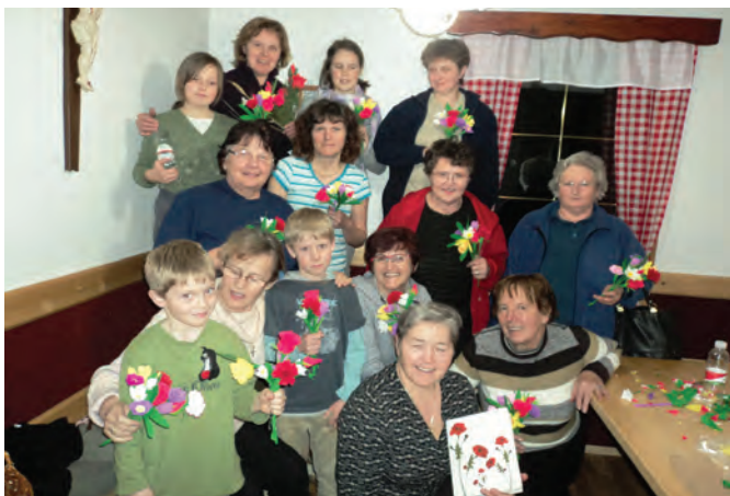
Delavnica izdelovanja rožic iz krep papirja

Dobivajo se tedensko, zdaj vsa torek dopoldne okrog devete ure oz. primerno prilagojeno obiskovalkam. Pletejo, kvačkajo, vezejo, zelo marljivo delajo, se učijo novitet, izmenjujejo izkušnje, različne informacije, vzorce, pomagajo