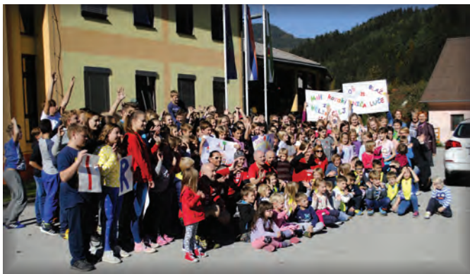
Skupinska fotografija je nastala v okviru dobrotelne akcije Mali koraki za velik cilj

Na naši šoli je pestro tudi kulturno dogajanje. Učenci, otroci v vrtcu in zaposleni vsako leto pripravljamo številne prireditve v šoli in v obeh krajih ter tako bogatimo kulturni utrip šole in kraja. Nekaj prireditev je že kar tradicionalnih, trudimo pa se vnašati v vsakodnevno življenje čim več novosti in sodobnih oblik umetnosti. Septembra imamo že kar tradicionalne prireditve; prvi delovni dan v šolskem letu je namenjen sprejemu prvošolcev, obeležimo svetovni dan jezikov, zadnje dni septembra pa smo na Juvanovih prodih imeli prireditev z naslovom Povodni mož v Savinji, v okviru projekta Dediščina gre v šole.