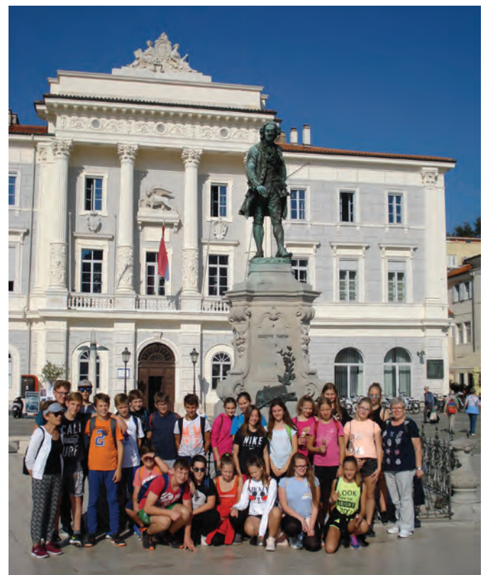
Osmošolci so v naravoslovnem tednu spoznavali Primorsko regijo