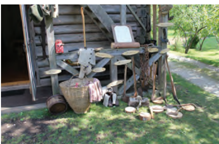
Društvo upokojencev je pri Vlcerski bajti pripravilo bogat kulturno etnološki program