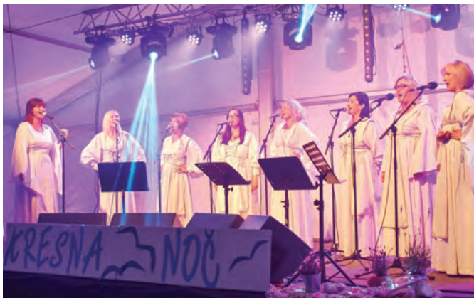
Ženska klapa Luka z Reke je med ženskimi klapami ena izmed uspešnejših

Letos so se člani okteta odločili, da svoj nastop popestrijo z melodijami morja in zato so v Luče povabili žensko klapo Luka z Reke, ki je med ženskimi klapami ena izmed uspešnejših. Pevke so si skozi leta dela in ljubezni do glasbe pridobile številne nagrade in so znane tako na Hrvaškem kot v tujini.