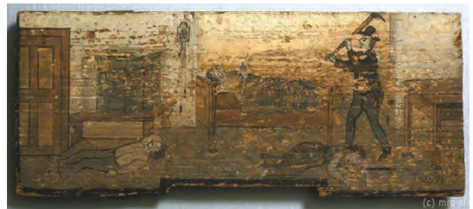
Panjske končnice z motivom umora v Strugah (Čebelarški muzej v Radovljici)

Ko je ponoči zmotno mislil, da že vsi globoko spijo, se je odplazil v sosednjo sobo, v kateri je gostilničar hranil gotovino. Toda njegov vstop sta domači ženski opazili. Čuvan je sedaj spremenil načrt, zgrabil nož in z njim sestri od gospodarice prerezal vrat, da se je mrtva zgrudila na tla.