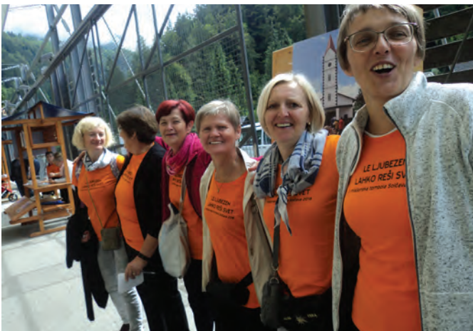
Sodelavke Karitasa so aktivno sodelovale pri pripravi in izvedbi misijonske tombole v Solčavi

Naši vsakoletni veliki akciji sta organizacija miklavževanja v cerkvi in koledovanja. Na začetku cerkvenega leta pomagamo pripraviti darila za Miklavža za okrog 100 otrok od drugega do osmega leta starosti (spečemo kekse, stvari za darila darujejo dobri ljudje, za nekaj stvari k darilu dodamo denar iz blagajne Karitas). Koledovanje izvajamo skupaj z župnijskim pastoralnim svetom. V Trikraljevski akciji je letos sodelovalo 56 otrok in 12 odraslih, ki so jih spremljali po domovih, koledniki pa so zbrali za misijone 4.532 €.