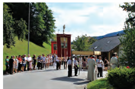
Nedeljska budnica v izvedbi Godbe Zgornje Savinjske doline in procesija v čast farnemu zavetniku sv. Lovrencu