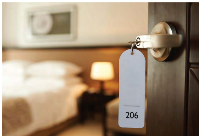
Ponudniki nastanitvene dejavnosti morajo voditi evidenco o turistični taksi

Ponudniki nastanitvene dejavnosti morajo tudi v prihodnje pobrano turistično in promocijsko takso do 25. dne v mesecu za pretekli mesec nakazati na poseben račun Občine Luče, št. 01267-4673206246, sklic 19 (davčna številka sobodajalca) – 07129. Poročila o pobrani turistični taksi zavezancem ni več potrebno pošiljati, saj občina podatke pridobi iz spletne aplikacije eTurizem.