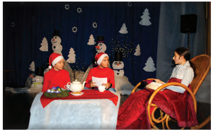
Božični bazar je ena izmed tradicionalnih prireditev

Novembra smo imeli na šoli razstavo Slovenskemu narodu ukradeni otroci. Otroci I. triade iz Solčave so nastopili na prireditvi Pesmi naših babic in dedkov v Cankarjevem domu,