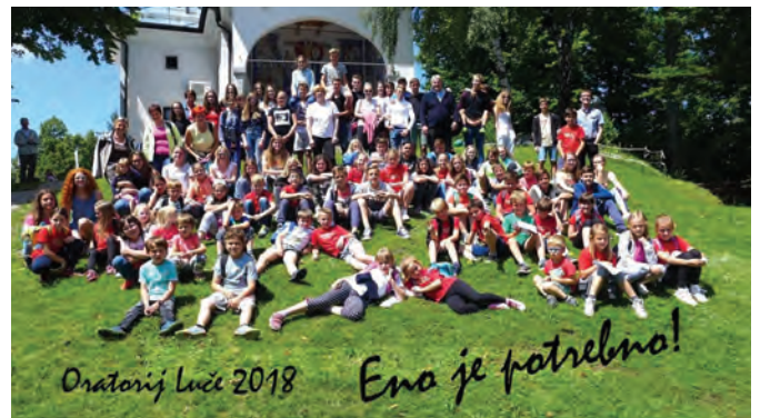
Povprečno se oratorija udeleži okrog 70 otrok

V okviru mladinske in otroške pastorale Župnije Luče smo animatorji mladinske skupine tudi letos pripravili poletni oratorij za otroke, ki je bil že enajsti zapored in je potekal od 9. do 13. julija pod geslom Eno je potrebno . Spoznavali smo Friderika Ireneja Baraga, Slovenca, ki je bil misijonar med Indijanci v Severni Ameriki, saj v letošnjem letu obhajamo 150-letnico njegove smrti.