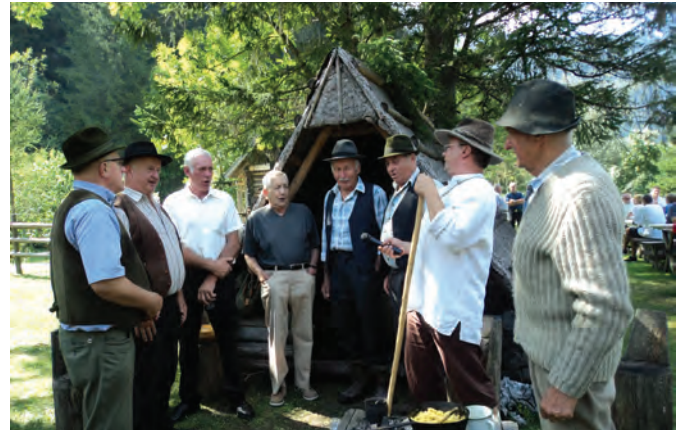
Skorjevka na novi lokaciji ob Vlcerski bajti

ter iz občinstva izbrani posamezniki so pa pomagali pri zdravljenju s »traparijami« in poskrbeli za sproščeno vzdušje.