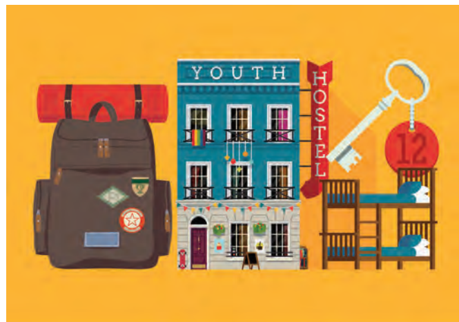
Razlog oprostitve plačila celotne ali dela turistične takse, mora biti vpisan v evidenco, ki se lahko vodi na podlagi knjige gostov

Ponudniki nastanitvene dejavnosti morajo tudi v prihodnje pobrano turistično in promocijsko takso do 25. dne v mesecu za pretekli mesec nakazati na poseben račun Občine Luče, št. 01267-4673206246, sklic 19 (davčna številka sobodajalca) – 07129. Poročila o pobrani turistični taksi zavezancem ni več potrebno pošiljati, saj občina podatke pridobi iz spletne aplikacije eTurizem.