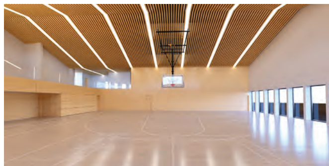
Predvidena notranjost športne dvorane

Glede uporabnosti je prečna varianta precej boljše, ker omogoča razporeditev spremljajočih prostorov vzdolž telovadnice. Ob pregraditvi telovadnice se lahko izvedejo dostopi do posameznega dela neposredno iz garderob, prav tako se ohrani celotno obstoječe igrišče, peš dostop do njega pa se lahko izvede na vzhodni strani šole. Zato je komisija predlagala občinskemu svetu, da se izvede prečna varianta in takšno izvedbo je nato potrdil tudi občinski svet. Na podlagi tega je bila potem naročena PGD dokumentacija, ki jo je pripravil STUDIO LIST d.o.o., Celje.