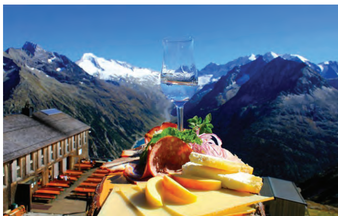
Prigrizek z razgledom (Gorniška vas Ginzling)

Mednarodna mreža Gorniške vasi (Bergsteigerdörfer) združuje kraje, ki svoj turizem razvijajo na temeljih gorniške tradicije, brez velike turistične infrastrukture in s trajnostnim pristopom. Zavedajo se potrebe po harmoniji med naravo in človekom, pri čemer človek spoštuje zmožnosti narave, zato je moto gorniških vasi: manj in zato bolje. Gorniške vasi tako na poseben način izpolnjujejo cilje Alpske konvencije, ki stremi k trajnostnemu razvoju v celotnem alpskem prostoru.