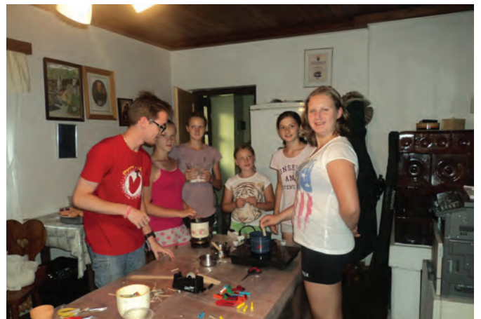
Pomoč mladih pri izdelavi dobitkov za srečelov

Samo 11 stalnih sodelavk šteje, seveda smo vesele, da nam pri posamičnih akcijah radi priskočijo na pomoč tudi drugi občasni sodelavci, še posebej se veselimo sodelovanja mladih. Mladi so nam lani pomagali pri ustvarjanju dobitkov in izvedbi dobrodelnega župnijskega srečelova, pri pripravi daril za starejše za božič oz. veliko noč, pri zbiranju živil pred trgovino Hofer ... In nikoli ne odrečejo, ko jih poprosimo, da se nam priključijo pri naših projektih. Zahvaljujemo se jim za sodelovanje in pomoč ter upamo, da jih privzgojen čut do bližnjega in do prostovoljnega dela nekoč pripelje do odločitve, da postanejo prostovoljci Karitas.