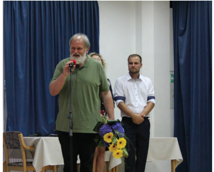
Pater je zbranim poleg besed zahvale namenil tudi nekaj lepih misli

Gospod Gržan je naš občan že dobro desetletje, ko se je priselil v odmaknjen del Konjskega Loga v Konjskem Vrhu. Že obnovitev stare domačije je sama po sebi vredna pohvale. Vendar glavna 'dodana vrednost' patra je prepričevalna moč pisane in govornjene besede, skromnost, poštenost, prijaznost, izjemna moč in sposobnost zdravljenja in graditve osebnosti, poiskati svetlo in sveto ali pozitivno misel za številna vznemirjenja in nemoči ljudi.