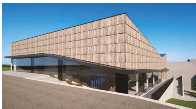
Pogled na novo športno dvorano z zahodne strani (s parkirišča pri Lampi)

Dosedanja telovadnica bi v vsakem primeru v prihodnjih letih bila potrebna temeljite obnove (nov športni pod, obnova strehe in energetska sanacija objekta), ob tem pa bi imeli še novo investicijo v športno igrišče, ob že nekaterih obstoječih športnih igriščih izven centra. Občinski svet se je po tehtnem razmisleku tedaj odločil, da se gre v projekt izgradnje nove telovadnice na območju obstoječe.