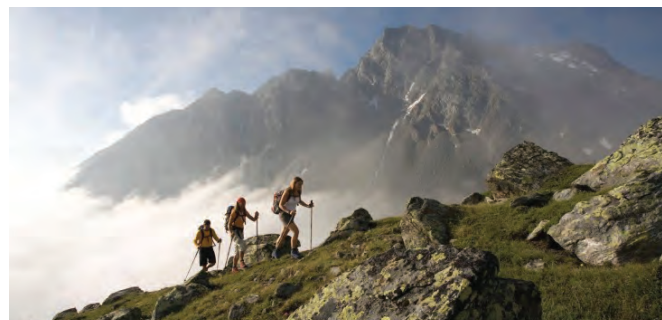
Planinska tura v gorniški vasi Vent

Zlasti pomembna so zunanja podoba in alpski pridih kraja, filozofija turizma, hribovsko kmetijstvo ter upravljanje gorskih gozdov, varstvo narave in krajine, okolju prijazna mobilnost/promet ter dobra komunikacija in izmenjava izkušenj med članicami mreže. Osnovno vodilo projekta je gibanje z lastno močjo, z odgovornim odnosom do narave in spoštovanjem kulturne in naravne dediščine kraja.