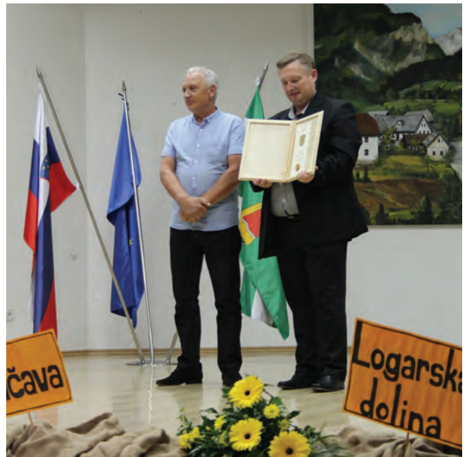
Planinsko društvo Luče upravlja s Kočo na Loki, ki letos obeležuje 40-letnico delovanja

Delovanje Planinskega društva Luče je vsa leta tesno povezano s Kočo na Loki, kjer je prva koča stala že leta 1903, ko jo je zgradila Ljubljanska nadškofija. Med I. svetovno vojno je bila koča požgana, po obnovi pa je služila kot lovska koča. Tudi med II. svetovno vojno je bila koča požgana, 1947 pa jo je obnovilo GG Nazarje.