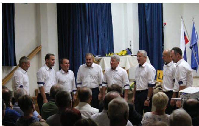
Oktet Žetev je skrbel za glasbeno popotnico

Osrednja slovesnost s podelitvijo priznanj je potekala v četrtek, 9. avgusta 2018, v Kulturni dvorani Luče. Kulturni program so sooblikovali učenci osnovne šole Blaža Arniča Luče ter člani Kulturnega društva Tone Mlačnik Luče.