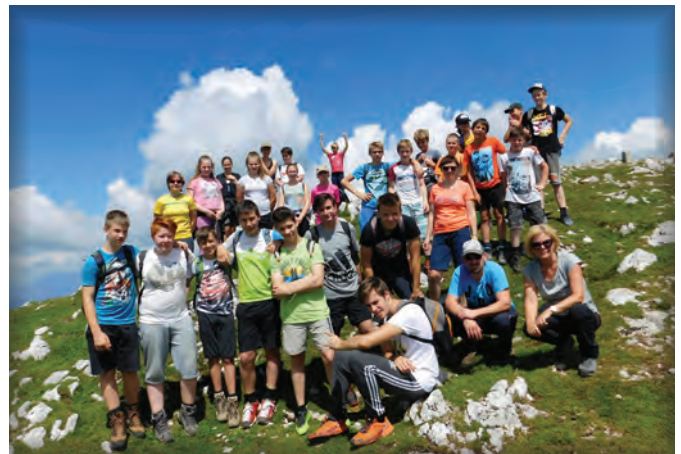
Planinski pohod na Raduho

Člani tehniškega krožka so letos izdelali Eifflov stolp, ki si ga tisti, ki ne boste šli v Pariz, lahko ogledate kar na prehodu naše šole, najmlajši so obiskovali tudi tečaj joge, četrtošolci iz Luč ter četrto- in petošolci iz Solčave pa so se pri kolesarskem krožku učili tudi varne vožnje s kolesom in uspešno opravili kolesarski izpit.