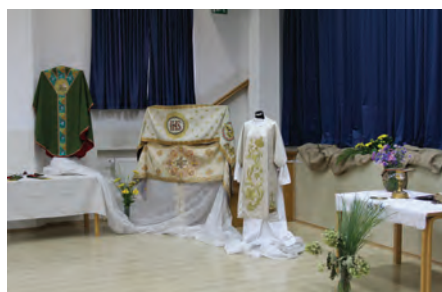
V kulturni dvorani sta bili na ogled razstavi mašnih plaščev in zapisov iz župnijske kronike ter podpisov naših dedkov izpred več kot sto let