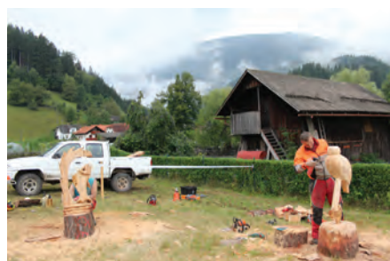
Tradicionalna sekaška tekma za lastnike gozdov in prikaz kiparjenja z motorno žago