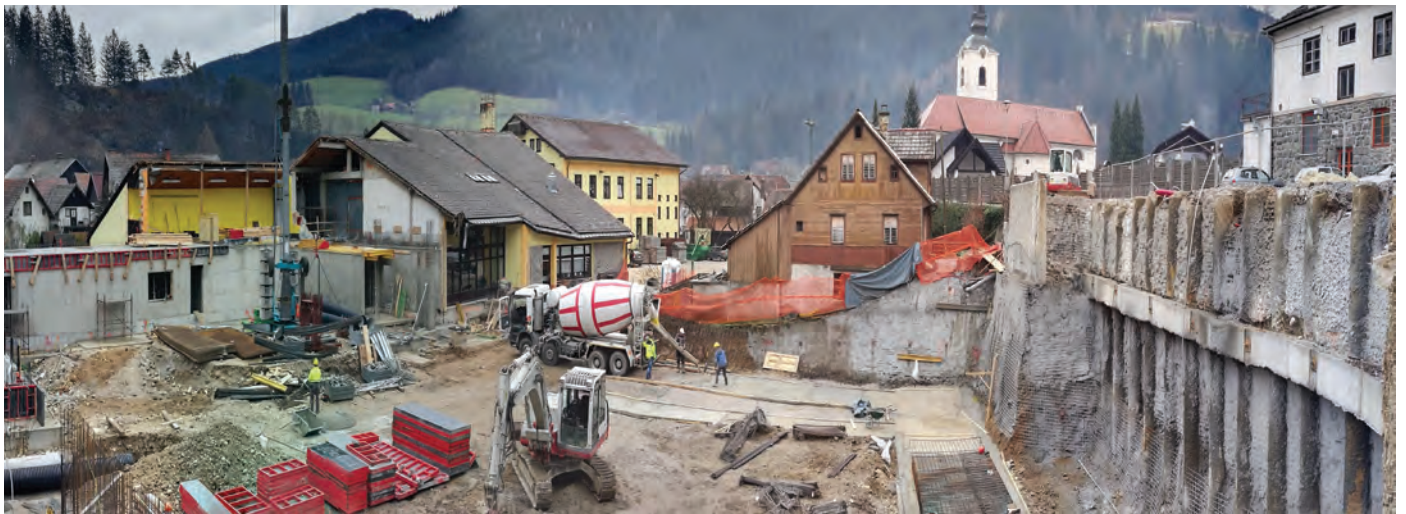
Panoramska fotografija gradbišča pri osnovni šoli

V maju 2017 je Ministrstvo za izobraževanje, znanost in šport nenajavljeno objavilo javni razpis za sofinanciranje investicij v novogradnje in posodabljanje športnih objektov. Naša občina je kot ena od petih slovenskih občin uspešno kandidirala na tem razpisu in pridobila nepovratna sredstva v višini 448.000,00 €. Od tedaj dalje je bilo potrebno še cel kup usklajevanj z različnimi subjekti, soglasodajalci, sosedi, tako da smo 20. 04. 2018 pridobili gradbeno dovoljenje za izgradnjo Športnega centra Luče. Potem je bil pripravljen javni razpis za izbiro izvajalca del. Na ta razpis smo dobili ponudbe treh izvajalcev. V skladu z zakonodajo je bil v juliju 2018 kot najugodnejši izvajalec del izbran DEMA PLUS d.o.o. iz Ljubljane s ponujeno ceno 1.872.680,53 € in z njim je bila tudi podpisana pogodba.