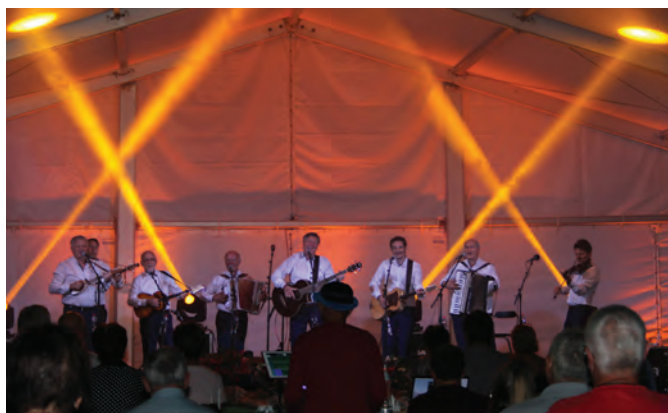
Praznovanje občinskega praznika so sklenili Prifarski muzikanti

Gospod Gržan občasno nastavlja tudi ogledalo sodobni potrošniški in neoliberalni družbi. Zato mogoče to nekaterim ni najbolj všeč, za razliko od preprostih ljudi, ki od globalizacije praviloma dobivajo le drobtine, ki padajo sodobnim Lazarjem z bogatinove mize.