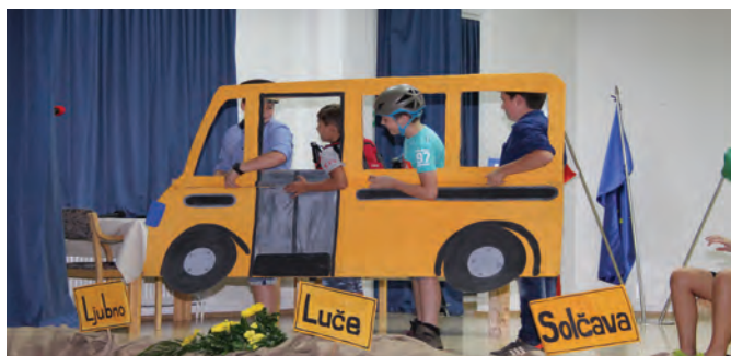
S počitniškim avtobusom na popotovanje