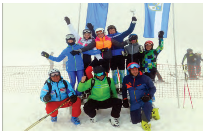
Že tretje leto zapored najboljša smučarska ekipa na državnem prvenstvu