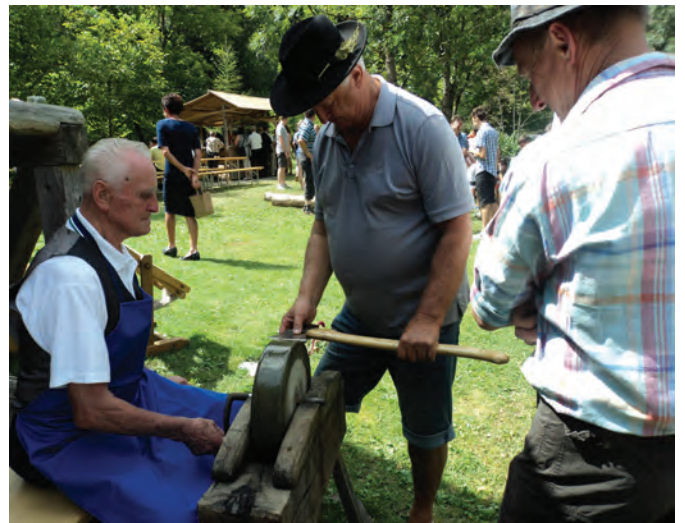
V času prireditve Lučki dan je pri upokojencih vedno pestro