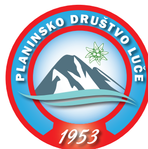
Logotip Planinskega društva Luče

Na tej prireditvi pa so planinci predstavili tudi logotip Planinskega društva Luče. Logotip je sestavljen iz napisa Planinsko društvo Luče in letnice ustanovitve društva.